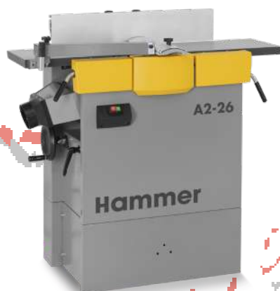
手押し自動鉋兼用機 A2-26