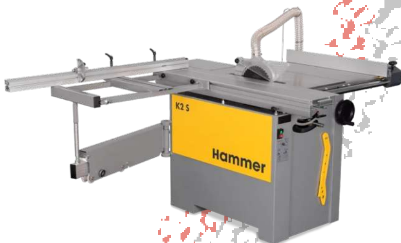
スライドソー K2 S