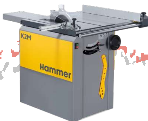
テーブルソー（軸傾斜昇降盤） K2 M