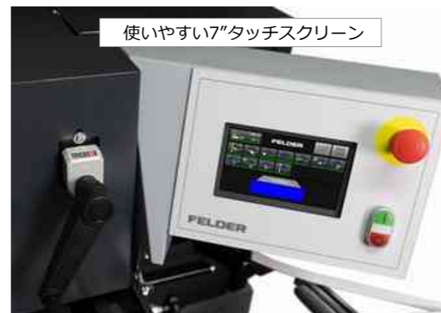
使いやすい7"タッチスクリーン