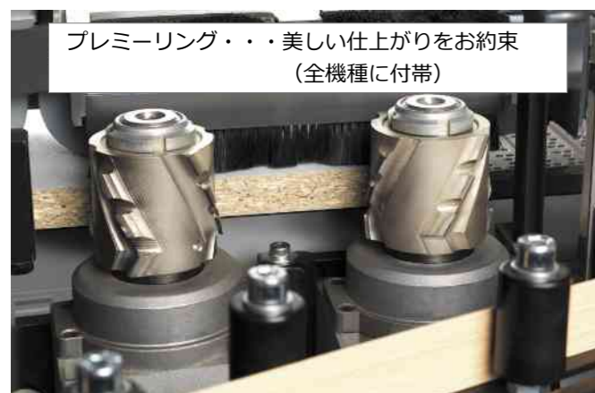
プレミーリング・・・美しい仕上がりをお約束 (全機種に付帯)