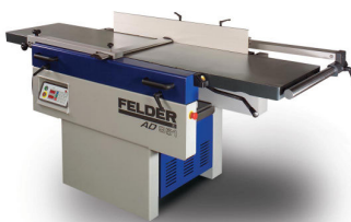
手押し、自動カナ兼用機 AD751(500mm幅)