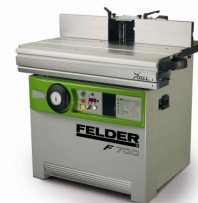
面取りからホゾ加工まで スピンドルモルダー F700Z