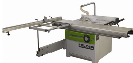
小型スライドソーのベストセラー K700P