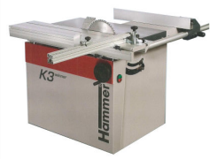
低価格スライドソー K3ウィナー

有限会社 ホルツテクニカ東京 東京都葛飾区青戸7丁目23番23号 TEL 03-6240-7721 FAX 03-6240-7734 www.holzher.jp www.felder-tokyo.jp