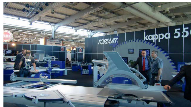
日本で着実にファンを増やしているフェルダ。中でもCNC制御スライドソーはランニングソーと同じソフトを装備、あらゆる段取りが自在に可能。

リグナハノーバーは世界最大の木工、林業機械展です。1,765社(52カ国)が出展し、来場者9万人(前回比13%増、内40%が外国からの来場者)。予想よりも多くの来場者で盛況でした。今回の最大の印象は、最新の技術が目白押しというよりも、従来の技術をさらに洗練させ、より身近、低コストでの実現を図っていることではないでしょうか？