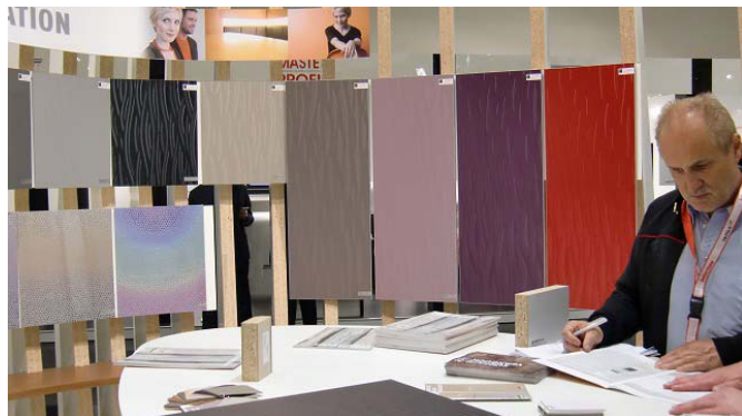
ボード、表面材で有名なPFLEIDERER(フライドラー)社の最新商品