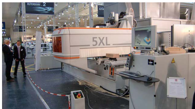
ホルツヘルはバイニヒグループに参入し初めてのリグナ展。ボード加工だけでなく、無垢材加工でのCNCの活躍の場もますます増えるでしょう。